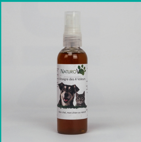
Vinaigre des 4 Voleurs