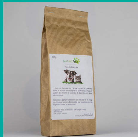
Terre de Diatomée