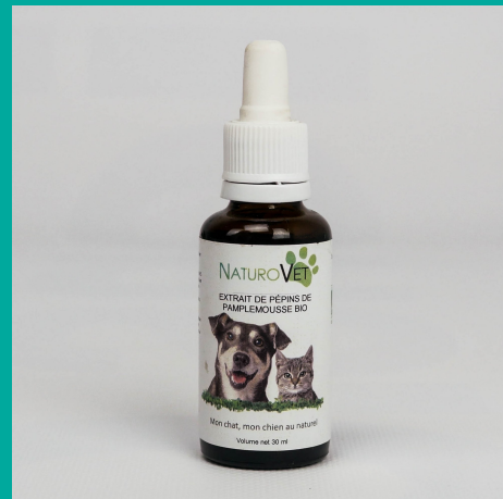
Extrait de Pépins de Pamplemousse